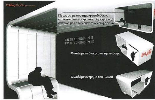
Φωτορεαλιστικές απεικονίσεις της στάσης λεωφορείου κατά τη διάρκεια της νύκτας

Την πρώτη θέση μεταξύ των 260 συμμετοχών κατέλαβε η πρόταση του Έλληνα αρχιτέκτονα Νίκου Πλασιέρα σε διεθνή διαγωνισμό που πραγματοποιήθηκε στην πολιτεία Γιούτα των Ηνωμένων Πολιτειών της Αμερικής. Ο διαγωνισμός διοργανώθηκε από το Τμήμα Αστικού και Μητροπολιτικού Σχεδιασμού και το Τμήμα Επικοινωνιών του Πανεπιστημίου της Γιούτα σε συνεργασία με τον οργανισμό συγκοινωνιών της πολιτείας (Utah Transit Authority). Οι διαγωνιζόμενοι έπρεπε να σχεδιάσουν μια στάση λεωφορείου σε συγκεκριμένο χώρο κοντά στο πανεπιστήμιο, ενώ οι αρχές της πολιτείας ήδη επεξεργάζονται την ιδέα